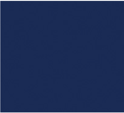
SKETI YA KUSHINDIA NJE ( rangi ya dark blue kitambaa cha suti kizito )