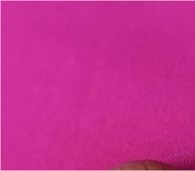
SKETI SARE YA DARASANI ( rangi ya damu ya mzee kitambaa cha suti kizito)