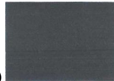
Sweta dark blue