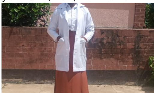
Koti jeupe (Lab coat).

iv.Dissecting Kit kwa wanafunzi wanaosoma baiolojia(Biology( na Koti jeupe (Lab coat) kwa wanafunzi wote wa sayansi CBG, PCB, PCM na PGM