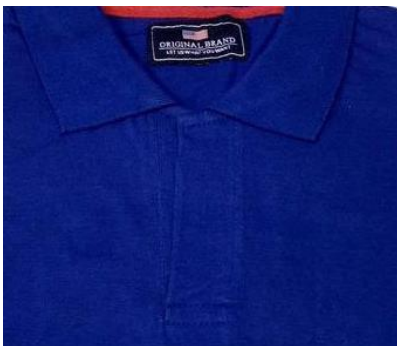
Tisheti ya Blue