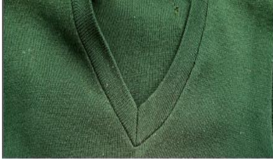
Sweta Rangi ya Kijani jeshi

Uje na sweta moja la rangi ya kijani na moja la rangi damu ya mzee.