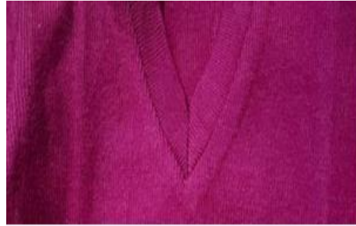
Sweta Rangi ya Damu ya Mzee