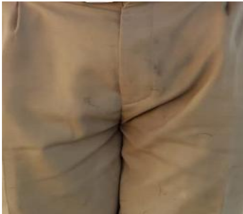
Suruali ya Khaki

Rangi za vitambaa vya suruali zimeambatanishwa hapo chini.