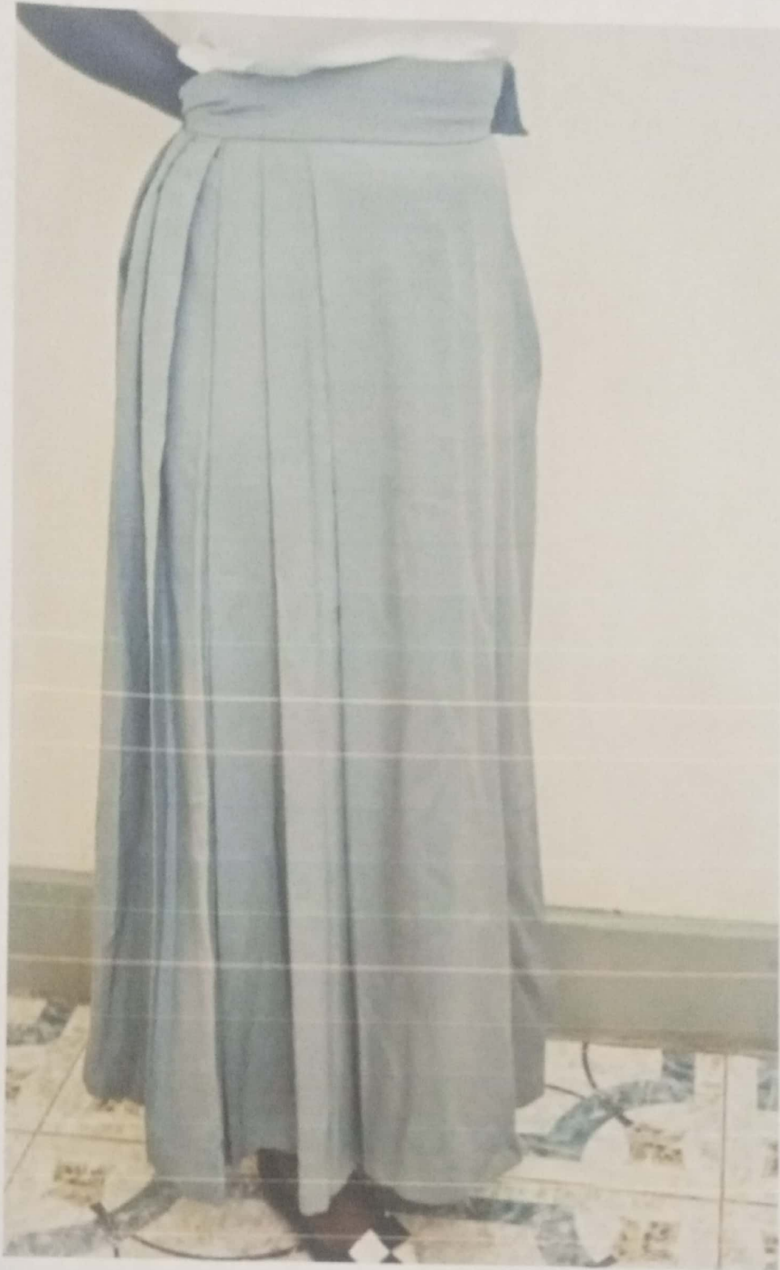
MFANO WA RANGI, MSHONO NA UREFU WA SKETI ANGALIA UKURASA WA 11 11