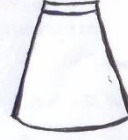
Sketi ya Michezo Njano