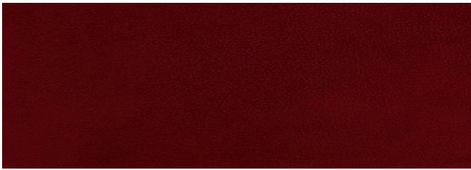
Sare ya shule (Suruali) Rangi: Damu ya mzee/maruni