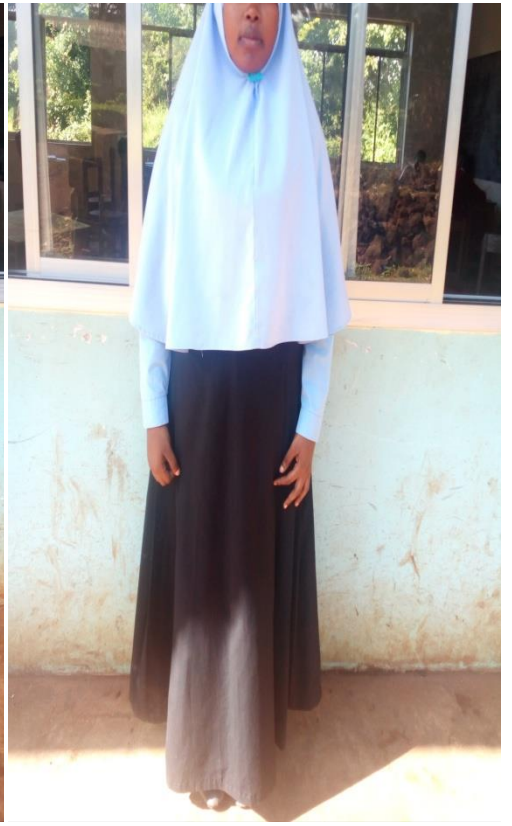
Sare za shule (darasani na nje ya darasa)